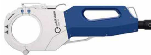
ORBIWELD X 3.0

Vlastnosti, rozsah použití, technické údaje a obsah dodávky, viz strana 2.