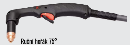
Ruční hořák 75°

(více volitelných možností hořáku viz www.hypertherm.com )