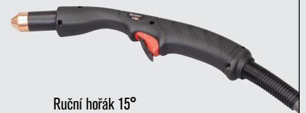
Ruční hořák 15°