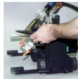
RYCHLOUPÍNAČÍ SYSTÉM HOŘÁKU

ARC-H a.s. Doudlevecká 17, CZ - 301 38 Plzeň Tel./Fax: +420 377 227 918, 377 221 145 E-mail: arc@arc-h.cz